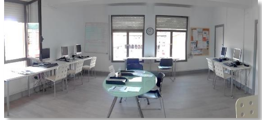
Nuevo Centro de Empleo en la 5ª planta de Madariaga.

Ubicadas en la 4ª y 5ª planta de la sede de Madariaga, se inauguraron en verano para responder a las exigencias de Lanbide, ha permitido ampliar los espacios de orientación y formación, y lograr de este modo aumentar la atención hasta el máximo histórico del área: 924 personas en 2016.