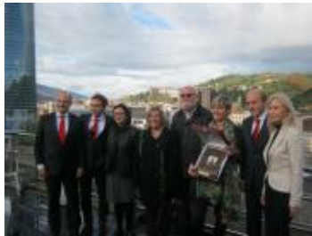
Representantes de la Fundación reciben el reconocimiento de la Directiva del Sevilla CF

El Sevilla CF, coincidiendo con su llegada a Bilbao para jugar un partido contra el Athletic Club, entregó el domingo 11 de Noviembre una placa en reconocimiento a los 27 años de labor desarrollada por Fundación Gizakia.