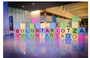
Panel sobre voluntariado en el XV Congreso Estatal.