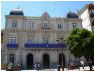
Ayuntamiento de Santurtzi

El Ayuntamiento de Santurtzi y Fundación Gizakia han firmado un nuevo convenio de colaboración en el marco del desarrollo del Plan Local de Prevención de Drogodependencias, del que se beneficiaron más de 1.500 alumnos/as durante el pasado año .