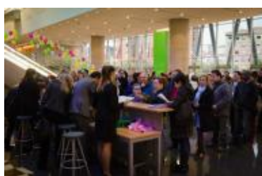
Proceso de acreditación a la entrada del Congreso.

Feli S., Corona, Karmele, Conchi A., Charo V., María, Mª Bel, Julia