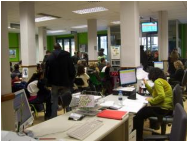
Imagen de una Oficina de Empleo

Desde el área de formación y empleo de la Fundación Gizakia trabajamos por el fomento de la inserción laboral de nuestros usuarios/as, apoyados por el Programa Incorpora de la Obra Social de la Caixa desde Enero de 2011. El trabajo de intermediación se está intensificando cada vez más, hasta llegar actualmente a contar con 269 empresas informadas, 132 personas beneficiarias en la bolsa de empleo del aplicativo informático con el que trabajamos y 60 inserciones laborales .