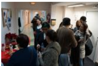
Asistentes al acto en la nueva zona de espera.

El pasado 10 de diciembre se inauguró, en los locales de Simón Bolívar 8, el espacio de ocio socioeducativo destinado a los y las jóvenes que acuden al Programa Hirusta de la Fundación Gizakia , dirigido a adolescentes con conductas de riesgo y a sus familias. Este proyecto ha sido apoyado por la iniciativa "Territorios Solidarios" del BBVA .