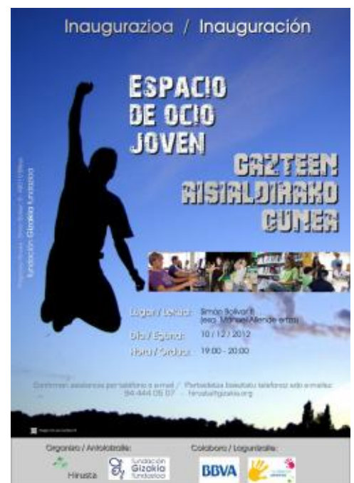
Cartel de inauguración elaborado por el equipo de comunicación de Gizakia.

En sucesivos números, os iremos informando de la marcha del recurso, las actividades desarrolladas y las novedades que vayan surgiendo. No queremos finalizar estas líneas sin agradecer de nuevo el apoyo y trabajo de todas las personas que, de una manera u otra, se han vinculado a este proyecto.