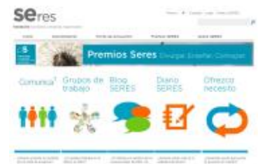
Web de la Fundación SERES

Fundación Gizakia abre de este modo una vía más para dar a conocer proyectos de interés general, así como un nuevo cauce de comunicación con potenciales entidades colaboradoras en los mismos.