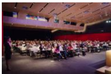
El auditorio del BEC prácticamente completo en la 2ª jornada del Congreso.